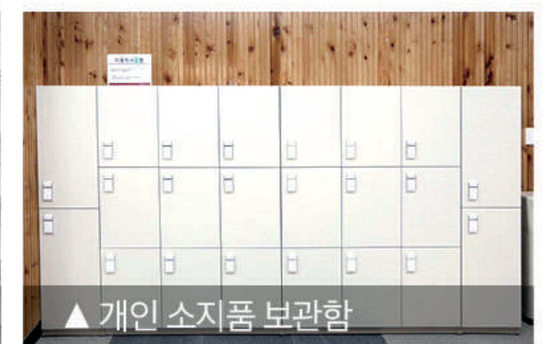
▲ 개인 소지품 보관함